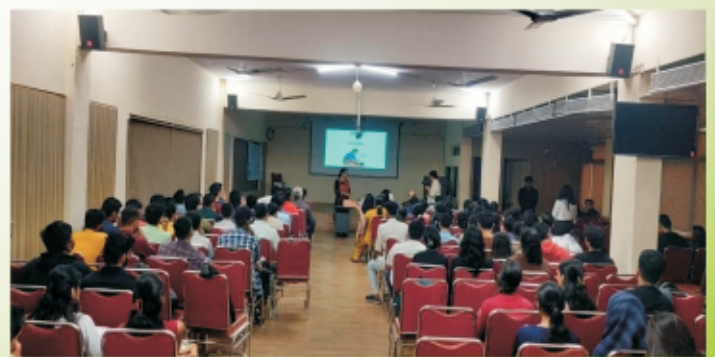
CPR workshop KC College