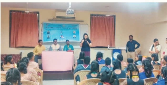
Shreerang Vidyalay Speaker Meeting