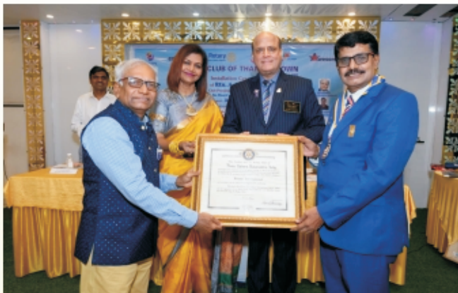
Awesome President Installation