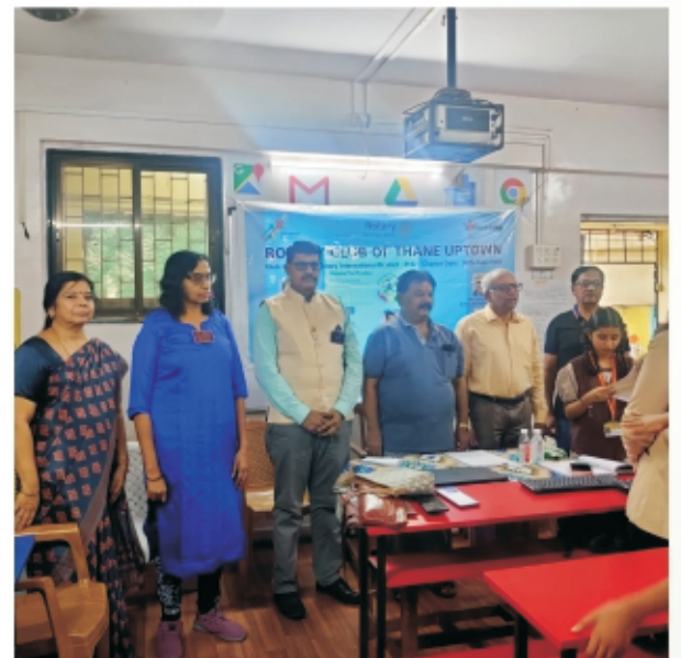
Balkum School Interact Installation