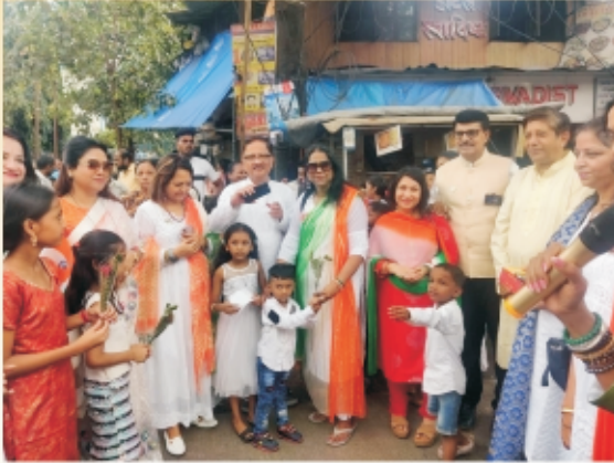
Independence Day Celebration with Wagle Street Children