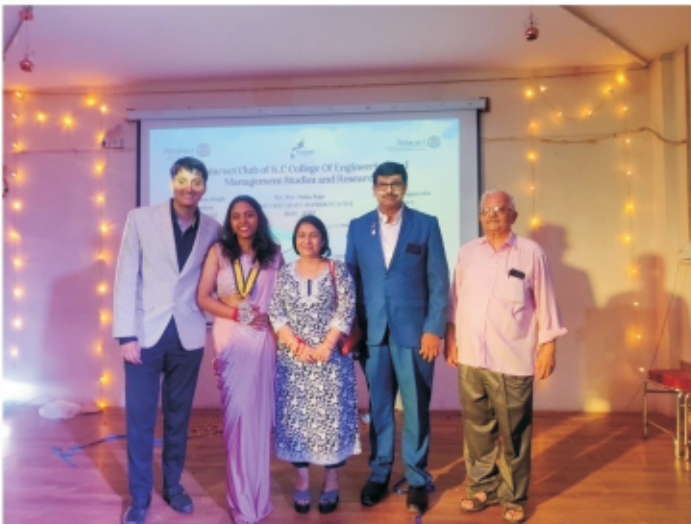
KC College Rotaract Club Installation