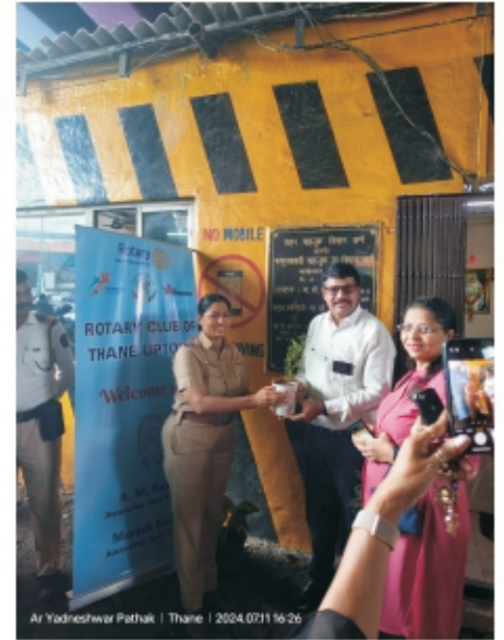
Rain Coat Distribution to Traffic Police Majiwada