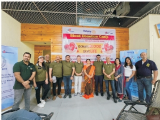
Blood Donation Korum Mall