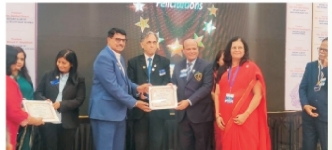
District PR Seminar