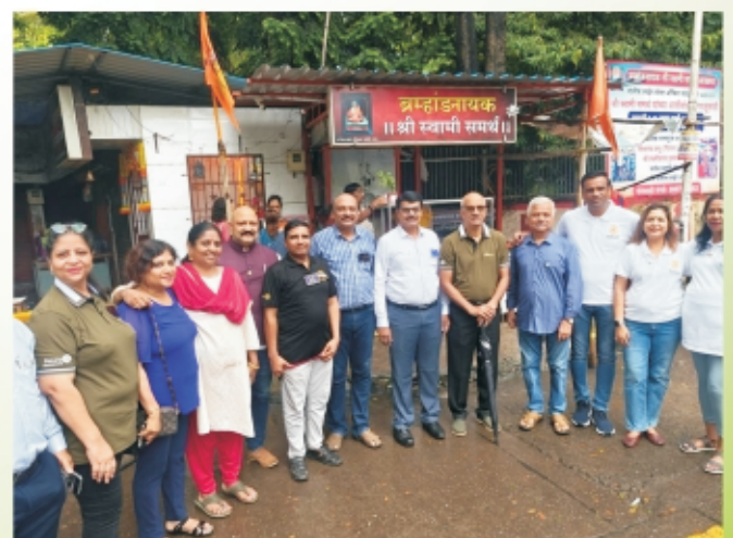
Annapurna Project at Swami Samartha Annachatra